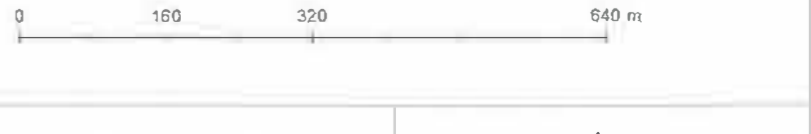
Abbildung Nr.: 24 Bearbeitung: bg, ms